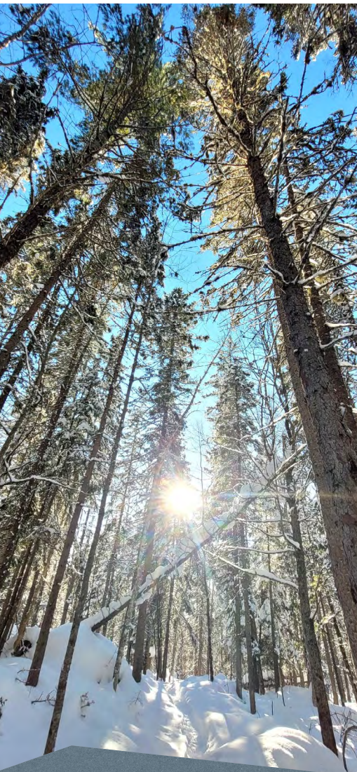
Sentier d'Ixworth en hiver

Municipalité de Saint-Onésime-d'Ixworth adjointe.dg@stonesime.com | 418 856-3018 www.stonesime.com