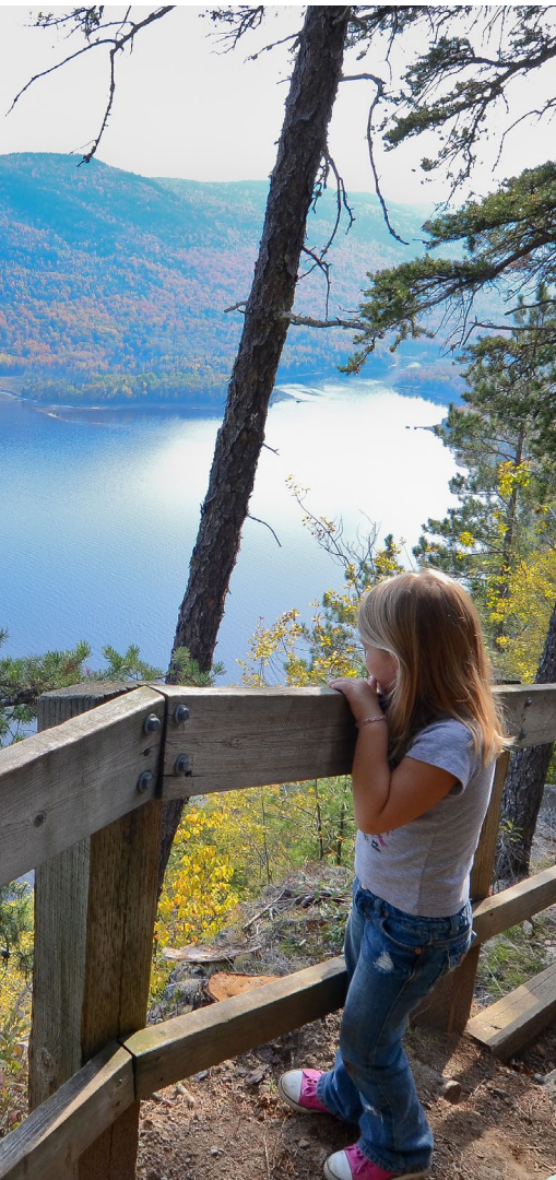
Point de vue sur le sentier