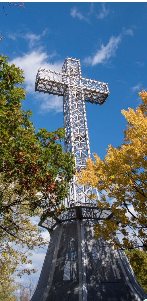
La croix du Mont-Royal