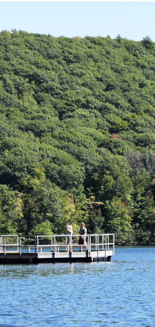
Quai sur le long du sentier Cédric Landuydt