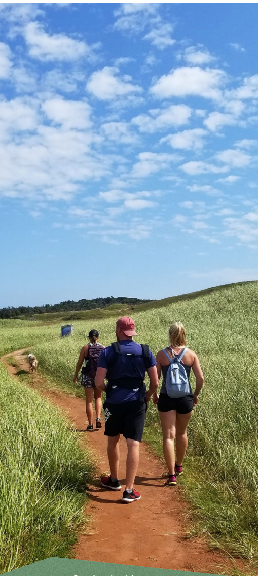
Sentier des Iris