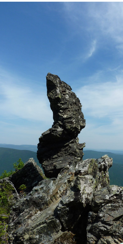
Point de vue du « Bonhomme »