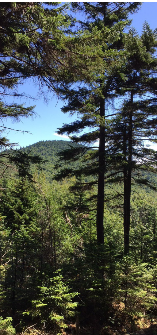
Point de vue 157 — Sentiers de l'Estrie