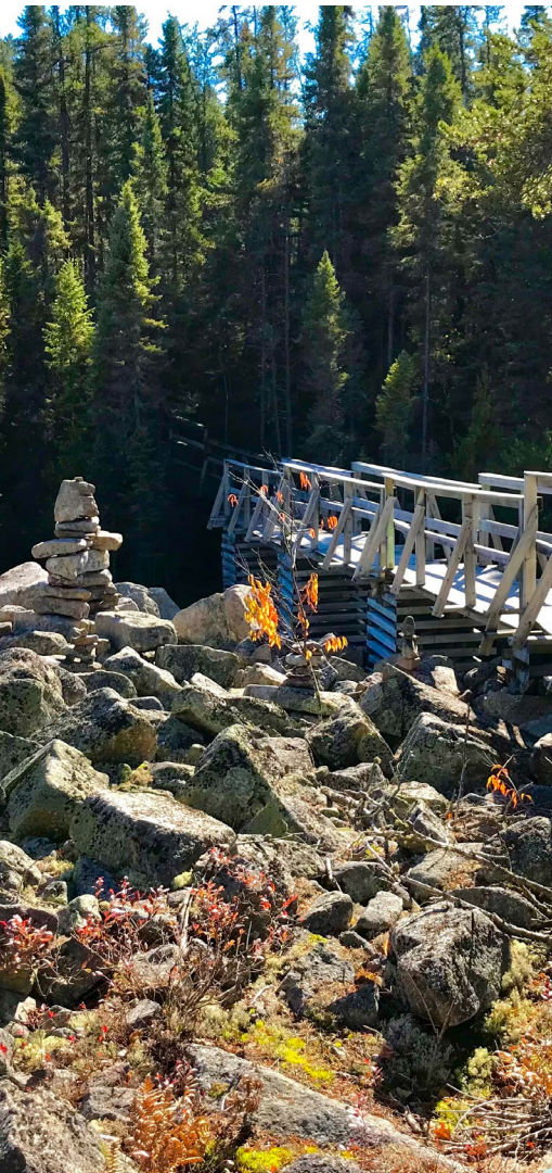
Passerelle sur le sentier