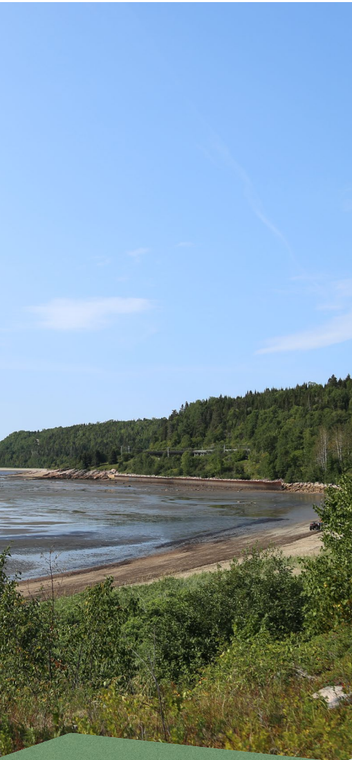
Vue sur le fleuve

Corporation de développement touristique de Forestville