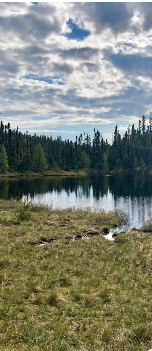
Lac Stevenson