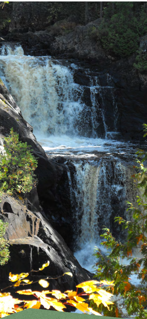
La chute Sainte-Anne Saint-Onésime-d'Ixworth

Municipalité de Saint-Onésime-d'Ixworth adjointe.dg@stonesime.com | 418 856-3018 www.stonesime.com