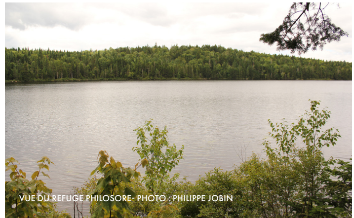
VUE DU REFUGE PHILOSORE

Restrictions : période de chasse. Informez-vous.