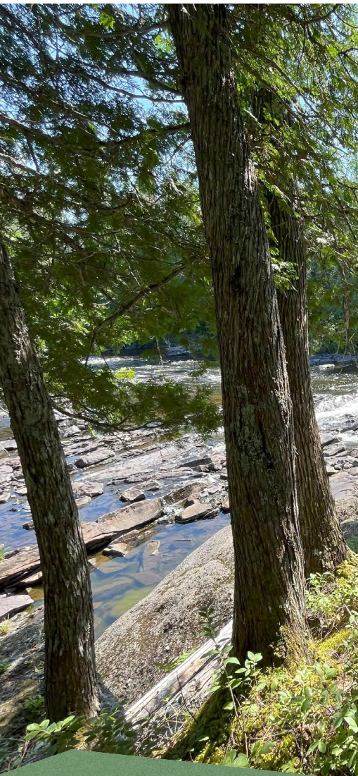
Sentier Ruelland