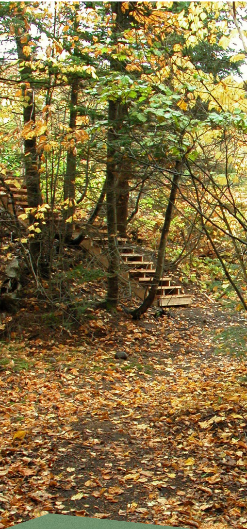
Sentier à l'automne Municipalité du village de Tadoussac