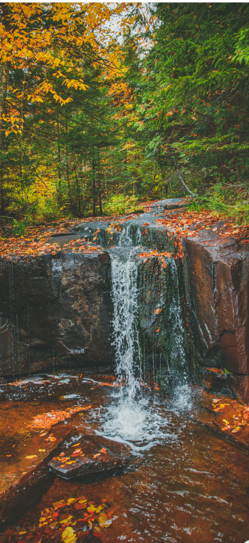
Cascades sur le sentier Cap-de-la-Fée