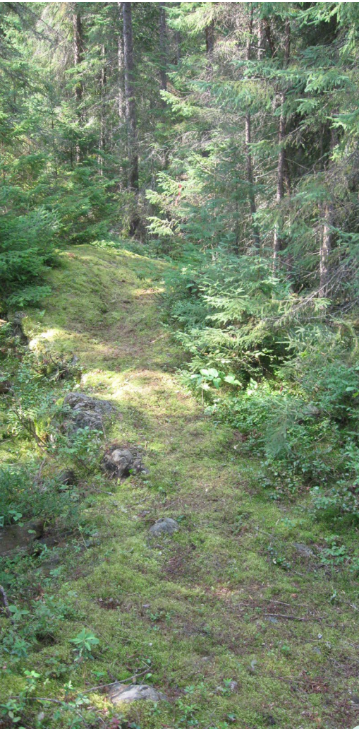
Sentier de la Grande Île