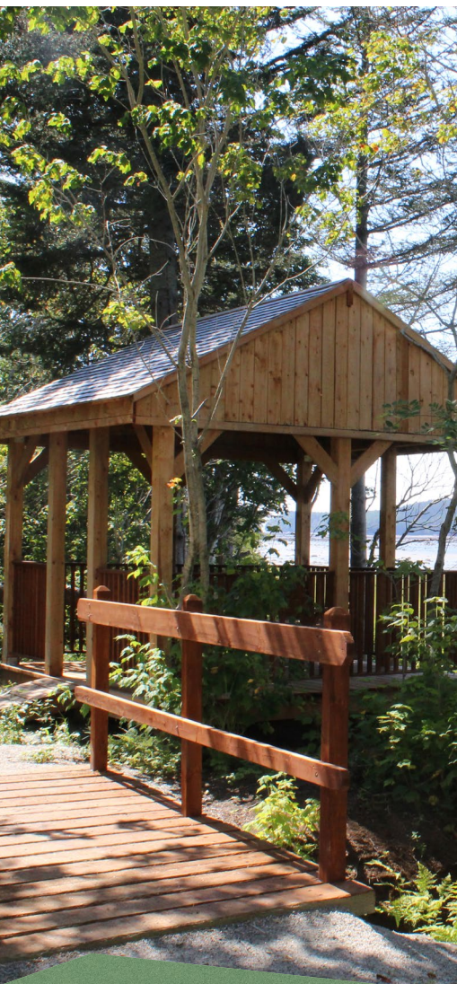
Belvédère de la boucle du village