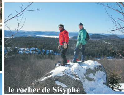
le rocher de Sisyphe