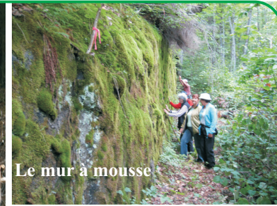
Le mur à mousse