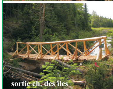
sortie ch. des îles