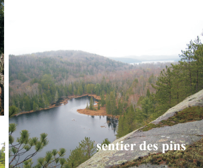
sentier des pins